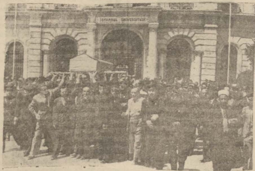
Cenaze Üniversite önünde talebenin elleri üstünde

Üniversite merkez binasında yapılan merasimde rektör, yetiştirdiği doçent ve profesörler heyecanlı hitabelerde bulundular