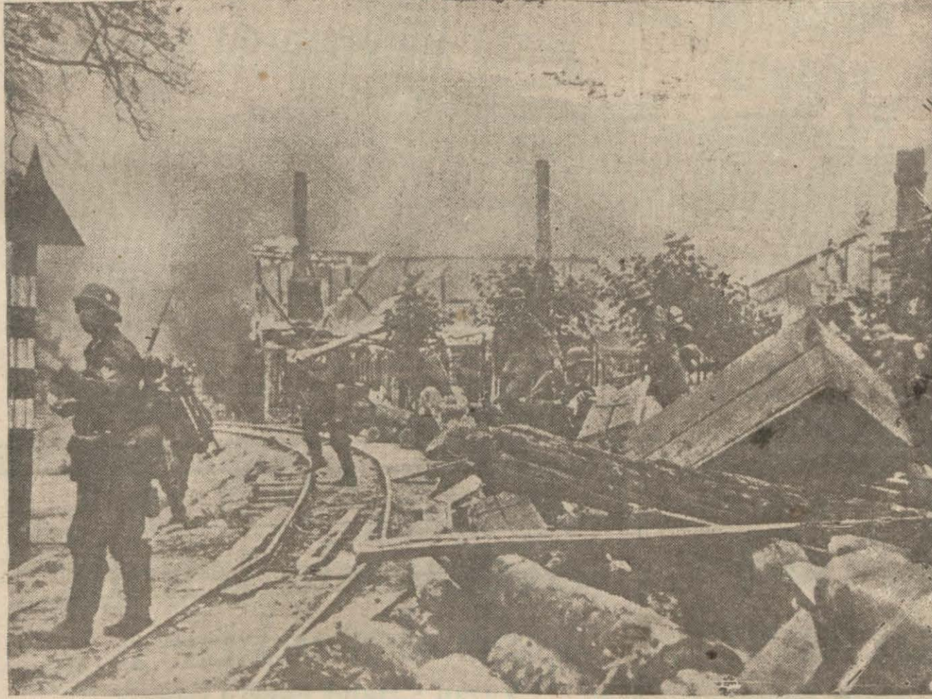
Alman - Sovyet harbinden intibalar: Yanan bir Sovyet şehrine Almanların girişi (Şark cephesi hareketına aid diğer resimleri son sayfamızda bulacaksınız)

Berlin 18 (A.A.) — Alman marcağı Görün, yarbay Mülders'e, bu harbe 101 inci hava muzaferiyeti münasebetile harareth bir tebrik telgrafı göndermiştir.